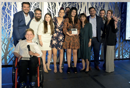
Platinum, Best per Industry, Reckitt Benckiser & Socialab