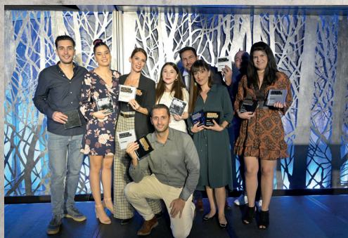
Content Brand of the Year, Durex