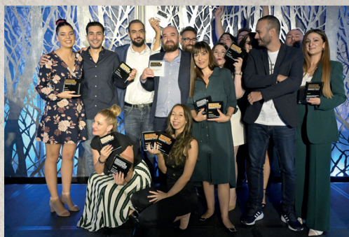
Content Agency of the Year, Socialab