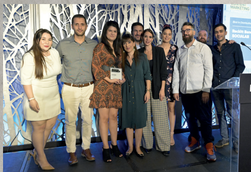
Platinum, Best in Distribution, Reckitt Benckiser & Socialab