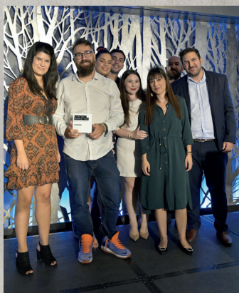
Platinum, Best in Strategy, Reckitt Benckiser & Socialab